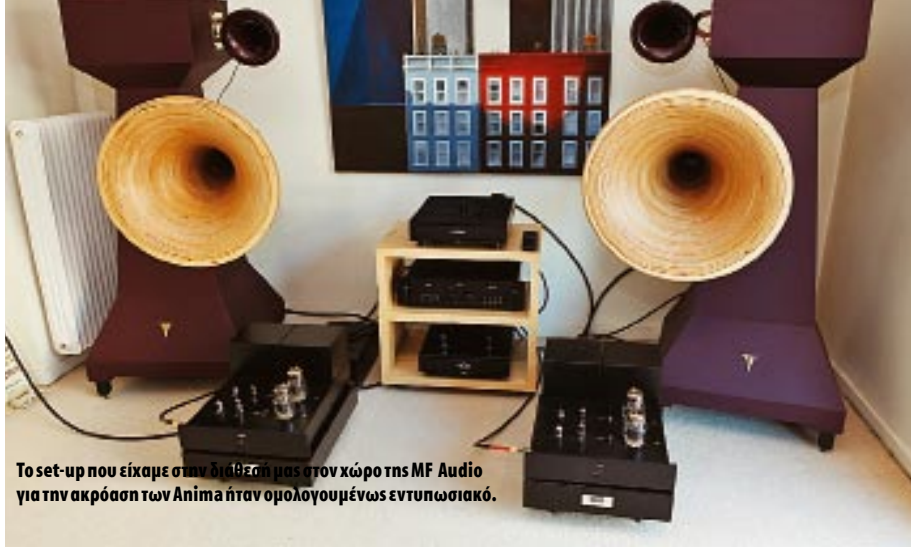
Το set-up που είχαμε στην διάθεσή μας στον χώρο της MF Audio για την ακρόαση των Anima ήταν ομολογουμένως εντυπωσιακό.